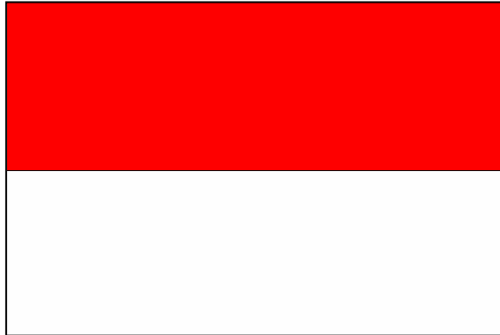
Le drapeau monégasque

Monaco est dans le département français des Alpes-Maritimes (06), sur la Côte d'Azur ; 1,95 km 2 ; 30 000 habitants et la capitale est Monaco. La langue officielle est le français et pour la nature de l'Etat, c'est une monarchie constitutionnelle. La monnaie est l'euro et la religion est catholique. On appelle les habitants les monégasques . Cet Etat s'étire sur 3 km et ne dépasse pas 200 à 300 mètres de largeur. Il a quatre noyaux urbains* : Monaco-Ville, Monte-Carlo, La Condamine et Fontvieille . Il doit sa fortune au tourisme, à son casino (fondé en 1862), à son régime fiscal* qui attire les sociétés étrangères, et à une industrie de pointe. Il y a un musée océanographique, un jardin exotique et, assez souvent, un Grand Prix automobile.