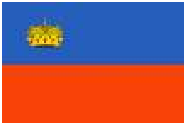
Le drapeau liechtensteinois

Le Liechtenstein est une principauté de l'Europe centrale, située entre la Suisse et l'Autriche ; 157 km 2 ; 28 000 habitants (dont 35 % d'étrangers, Suisses surtout). La capitale est Vaduz et le Liechtenstein est une monarchie constitutionnelle. La langue officielle est l'allemand, la monnaie est le franc suisse et la religion est le catholicisme pour 87,1 % des habitants qui sont appelés les liechtensteinois (es) .